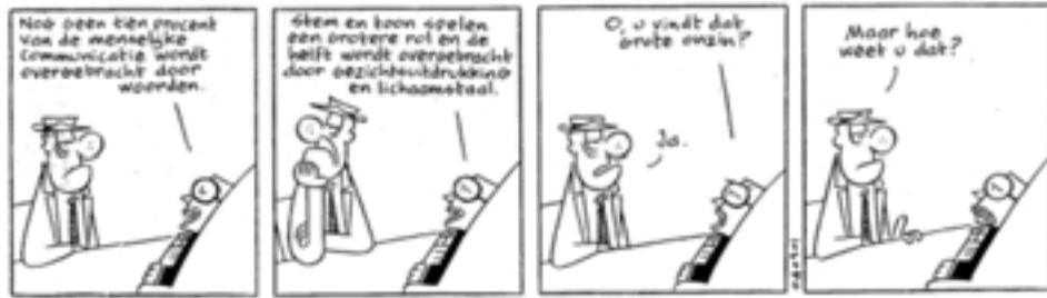
Sigmund: © Volkskrant 1 maart 2004